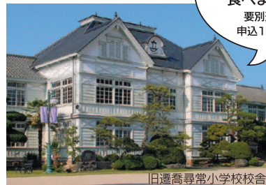
旧遷喬尋常小学校校舎

講師と一緒に お話ししながら給食を 食べませんか? 要別途800円 申込1週間前まで